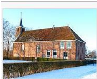
De tot hervormde kerk omgevormde kloosterbrouwerij

Om allerlei redenen bevalt na ruim 150 jaar deze vaart niet meer en wordt aan de west-noordkant van Surhuisterveen door de Staten van Friesland in 1648 de opdracht gegeven een nieuw kanaal te graven: Nieuwe Compagnonsvaart. Het kanaal loopt via Roodeschoor (hier zijn de resten van een sluis nog zichtbaar) naar het vroegere Kolonelsdiep. U loopt er langs, zo'n half uur gaans voor het einde van de tocht.